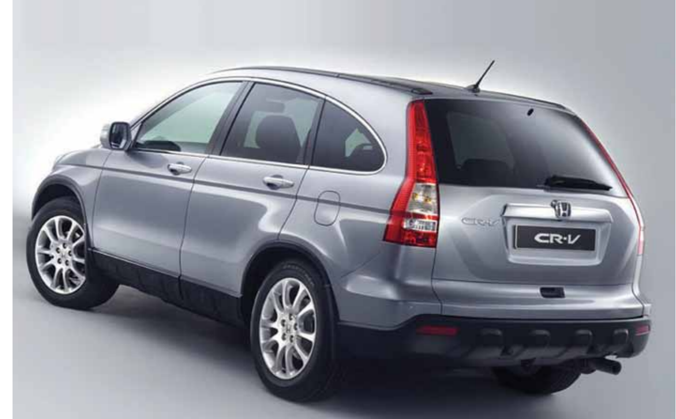
Honda CR-V, 2010 -, catalogusprijs € 32.995 - € 55.675

Door de jaren heen is de regeling ook de weerslag geworden van de schadeafwikkelingspraktijk van verzekeraars. Recente ontwikkelingen werpen dan ook de vraag op of modernisering van de BR 16 gewenst is, en zo ja hoe? Hierover gaan we op 30 november met verzekeraars in gesprek om samen met hen de werking van de BR 16 verder uit te diepen.